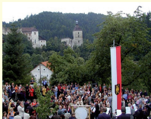
Veranstalter Marktgemeinde Tragwein